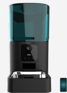
PUMBA 6000 PURRFECT MEAL SMART VISION