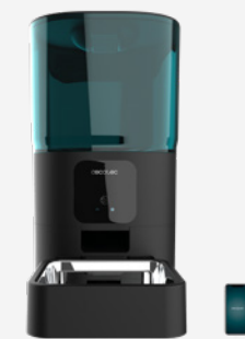
PUMBA 6000 PURRFECT MEAL SMART